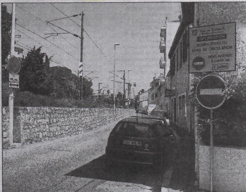
Un essai de sens unique sur le boulevard de la Source a commencé lundi dernier. Il préfigure d'autres modifications du plan de circulation du quartier.

tail de ce projet dans notre édition du 21 juin, et depuis, plusieurs lecteurs nous ont fait part de leurs observations. François Ragiot, par exemple, habitant de la rue de Golfe-Juan, émet quelques réserves : « Pour les parents de l'école Croisette venant de l'Est et les riverains des Hespérides, le projet allongerait et compliquerait la desserte du quartier en y ajoutant de nouveaux dangers. », remarque-t-il en acceptant néanmoins l'idée du sens unique du boulevard de la Source.